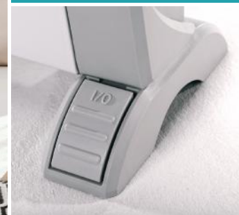
Interrupteur marche/arrêt au pied : l'astuce pratique pour ne pas avoir à se baisser