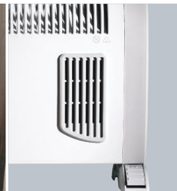
Fonction Turbo "Grille de diffusion de chaleur"