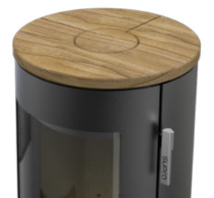
Pierre de grès avec un effet bois en option.