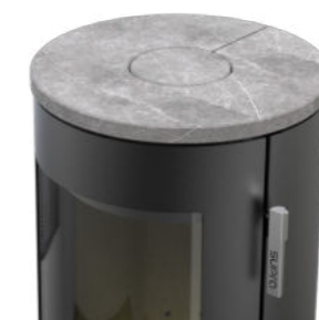
Pierre ollaire gris clair en option.