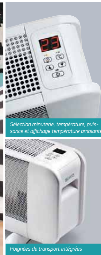
Sélection minuterie, température, puissance et affichage température ambiante